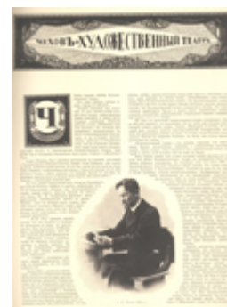
Страница из кн. « Московский Художественный театр » (СПб., 1914).

Из других редких изданий А. П. Чехова, которые вышли уже после его кончины, стоит рассказать о фотоальбоме большого формата (40x30) « Московский Художественный театр » (СПб., 1914). На первом листе из темно-серой плотной бумаги – фотопортрет Чехова, сделанный в Ялте в 1897 г. (в нашем издании отсутствует). В книжный блок вставлены несколько листов плотного картона, на которые вручную наклеены оттиски с фотографий артистов Художественного театра, много редких фотографий Чехова, макеты декораций к спектаклям, есть программа первого представления « Дяди Вани », фотографии сцен из спектаклей, портреты актеров, а также прекрасные карандашные наброски портретов К. С. Станиславского и В. И. Немировича-Данченко. После листа с портретом Чехова идет предисловие, написанное В. И. Немировичем-Данченко. Далее в красивой заставке – название статьи Н. Эфроса: « Чехов и Художественный театр ». Это издание прежде всего о тесной и благородной связи между «театром Чехова», как часто называют Художественный, и драматургом этого театра, автором « Чайки » и « Вишневого сада ».