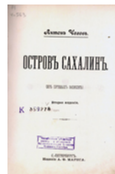
Титульный лист т.10