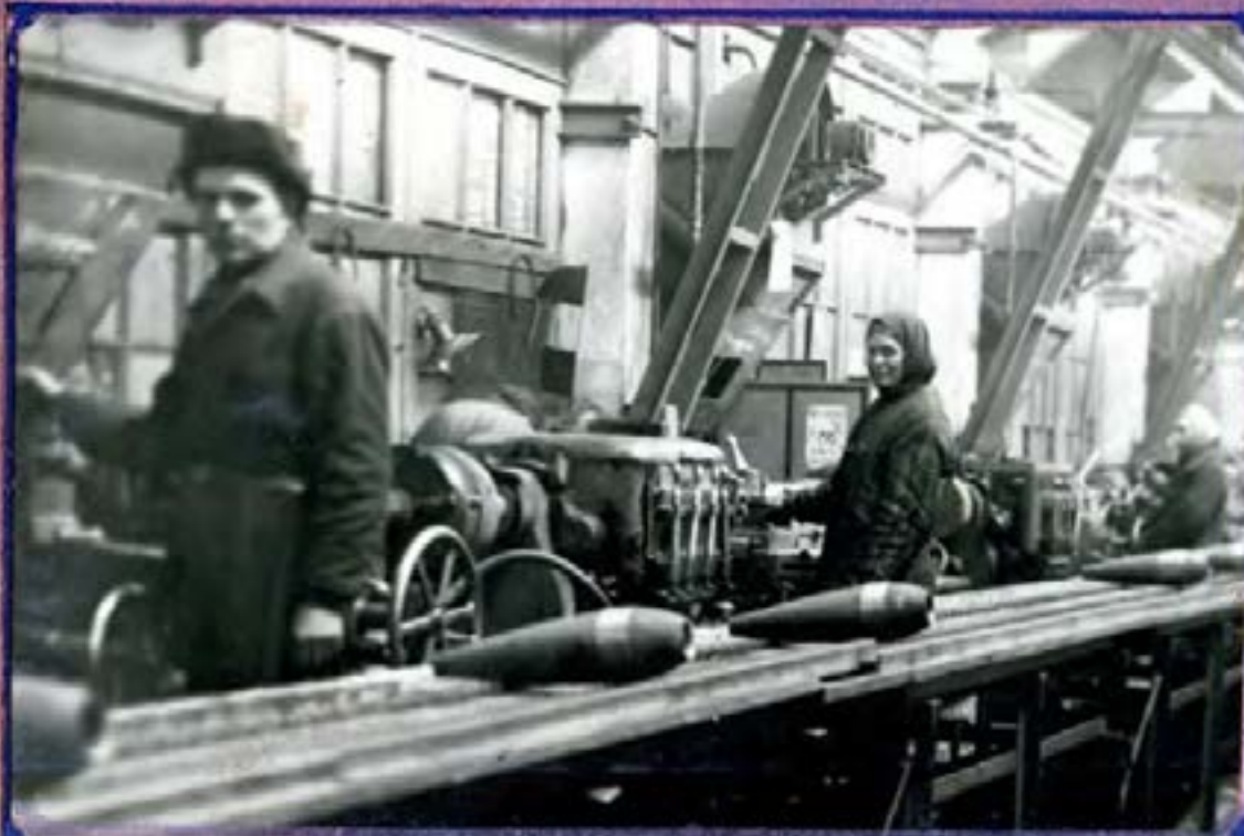
производство 120мм. мин на потоке