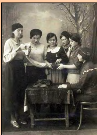
Кружок ПВХО. 1941 г.

В военные годы все сотрудники библиотеки стали курсантами учебной группы по ПВХО (противовоздушная и противохимическая оборона). Занимались по средам и пятницам в две смены: утренняя – с 7.40 до 9.40 (28 человек), вечерняя – с 20.00 до 22.00 (17 человек).